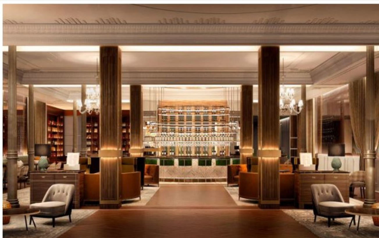
Gran Hotel Inglés en Madrid.